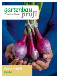
Sonderheft Zwiebel I + II