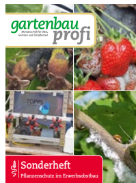
Sonderheft Pflanzenschutz im Erwerbsobstbau