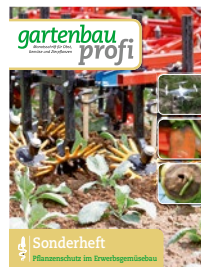
Sonderheft Pflanzenschutz im Erwerbsgemüsebau