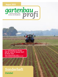
Sonderheft Zwiebel I + II