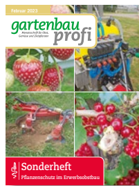
Sonderheft Pflanzenschutz im Erwerbsobstbau